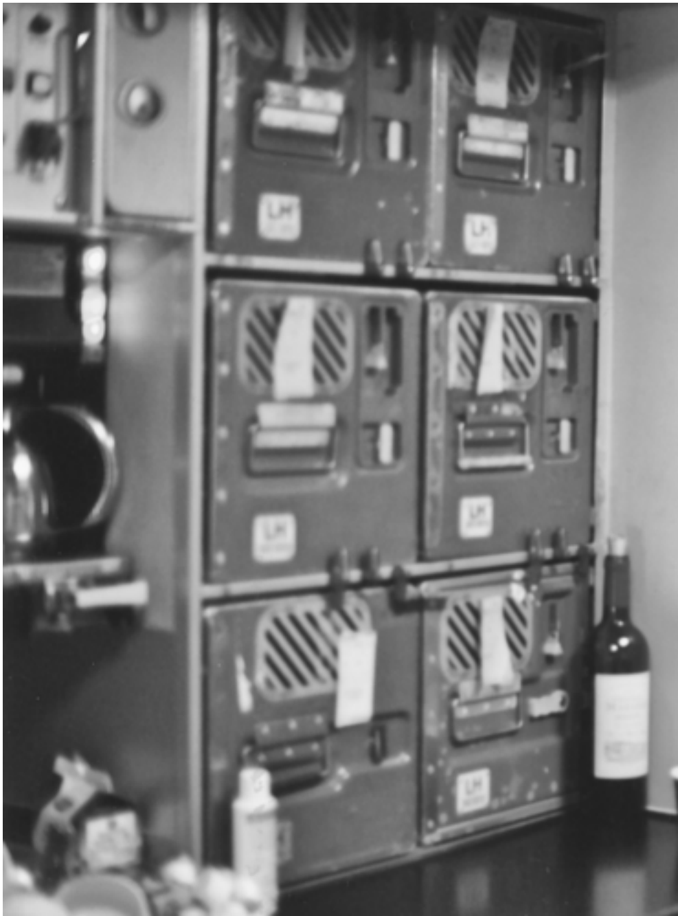
Telefonat mit der BILD-Redaktion: Am Satellitentelefon der Lufthansa-Maschine nach New York