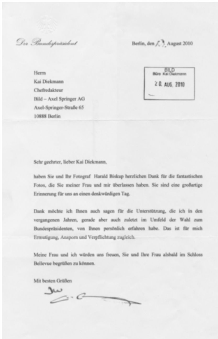
»Ermutigung, Ansporn und Verpflichtung«: Brief von Bundespräsident Wulff nach seiner Wahl zum Bundespräsidenten